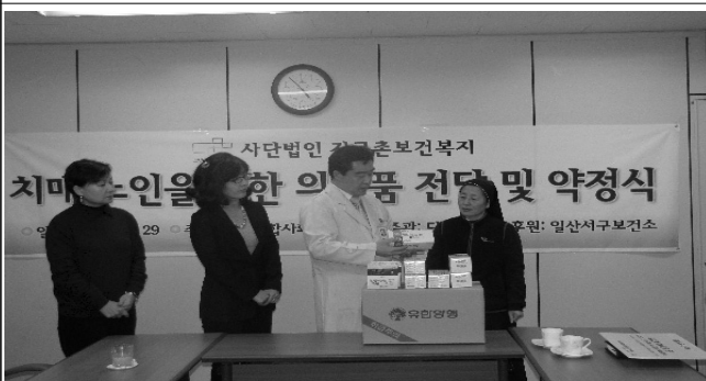
치매노인을 위한 의약품 전달