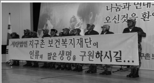
지구촌보건복지 창립 기념(아프리카공연단)