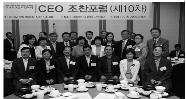
제10차 CEO 조찬포럼(2013. 06. 18. 국회 귀빈식당)