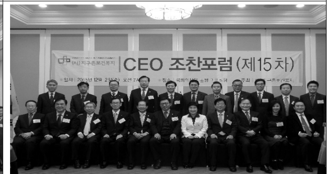
제15차 CEO 조찬포럼(2015. 12. 05. 국회 귀빈식당)