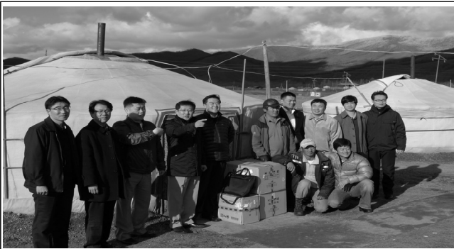
몽골 바가노르 지역병원에 의약품 전달