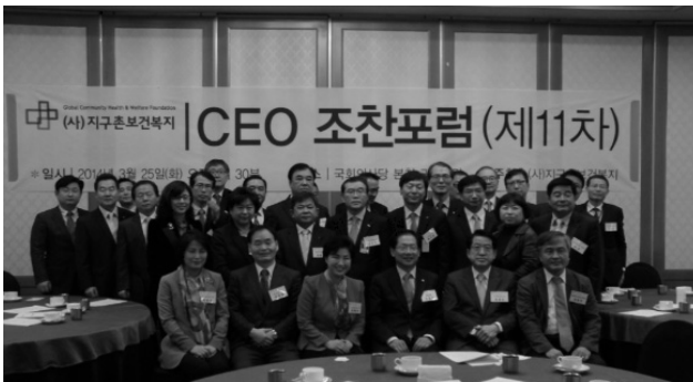
제11차 CEO 조찬포럼(2014. 03. 25. 국회 귀빈식당)