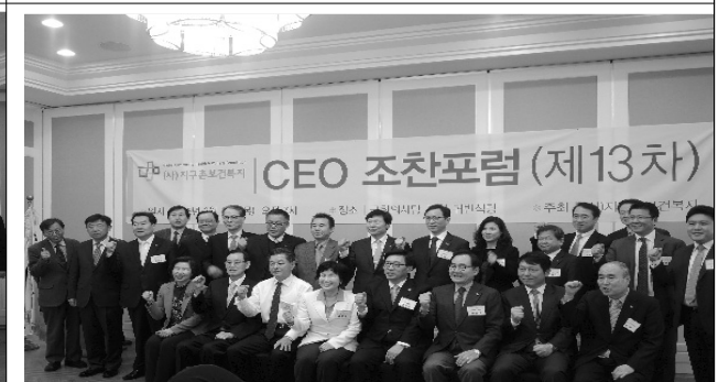
제13차 CEO 조찬포럼(2015. 03. 19. 국회 귀빈식당)