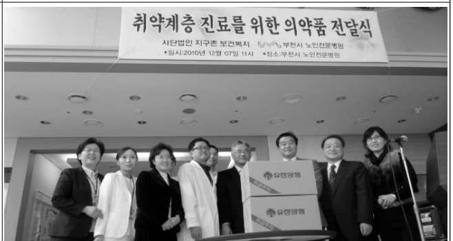
취약계층 진료를 위한 의약품 전달