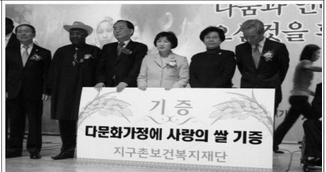
다문화가정 "사랑의 쌀" 전달