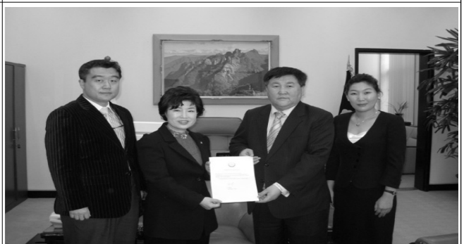
몽골 의약품 전달(몽골복지부장관)