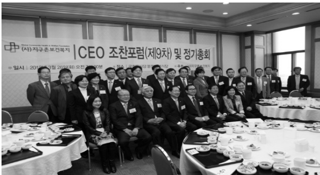
제9차 CEO 조찬포럼(2013. 03. 26. 국회 귀빈식당)