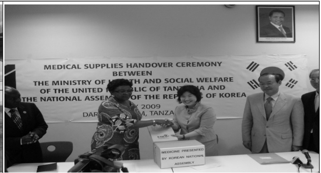
탄자니아, 케냐, 이집트 아프리카 3국 의약품 전달