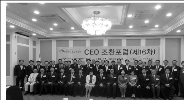
제16차 CEO 조찬포럼(2016. 06. 14. 국회 귀빈식당)