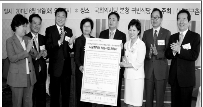
다문화가정 지원 협약식