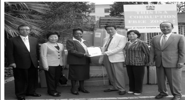
탄자니아, 케냐, 이집트 아프리카 3국 의약품 전달