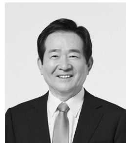
국회의장 정 세 균

기아 문제를 그냥 둔다면 미래의 어느 날 우리 아이들이 이렇게 말할지도 모른다. “알고 있으면서 왜 아무것도 하지 않았나요?”