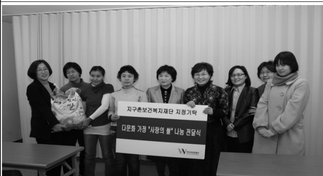
다문화가정 "사랑의 쌀" 전달