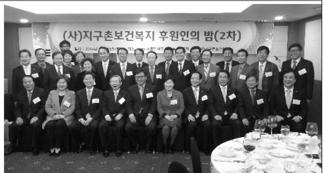
지구촌보건의복지 후원인의 밤(2014년)