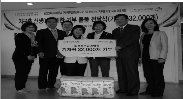
다문화가정 신생아를 위한 기저귀 전달