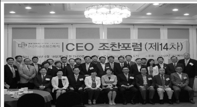
제14차 CEO 조찬포럼(2015. 06. 18. 국회 귀빈식당)